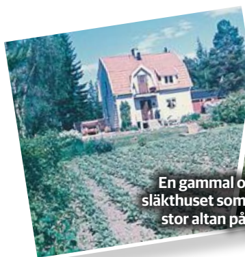
En gammal och en ny bild på släkthuset som byggts ut med en stor altan på övervåningen.